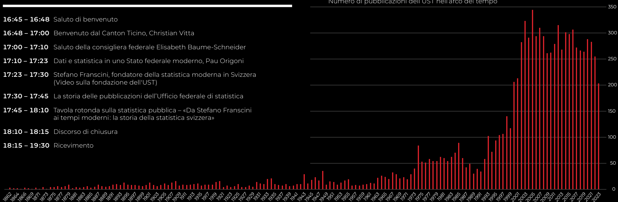
Numero di pubblicazioni dell'UST nell'arco del tempo