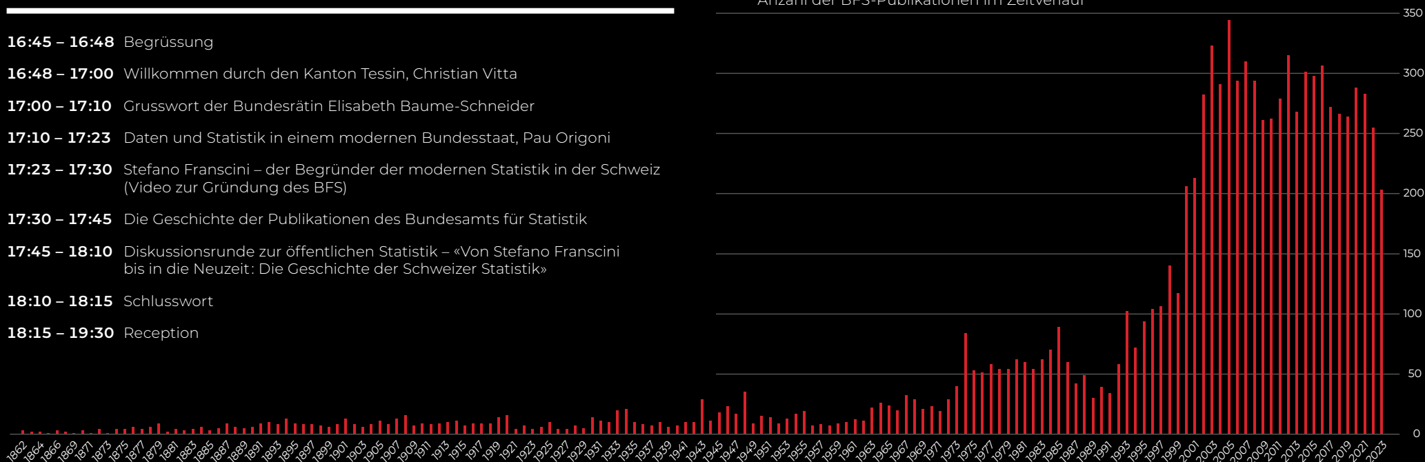
Anzahl der BFS-Publikationen im Zeitverlauf